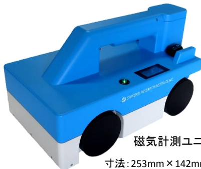
磁気計測ユニット