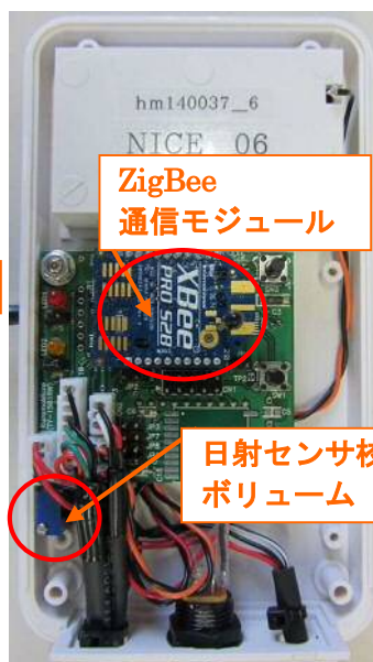
【電池ソケット (裏面)】